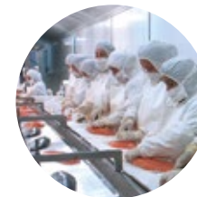
AKTIVITÄTEN NACH DEM ABFISCHEN

Der GLOBALG.A.P. Standard für Aquakultur ist ein universelles Zeichen für Gute Aquakulturpraxis, er fördert die Produktion und Vermarktung sicherer Lebensmittel bei gleichzeitigem Schutz knapper Ressourcen. Durch ihn können Produzenten und Markeninhaber den Verbrauchern die Sicherheit geben, dass Lebensmittel verantwortungsvoll und unter ökologisch verträglichen Bedingungen erzeugt werden. Der GLOBALG.A.P. Standard für