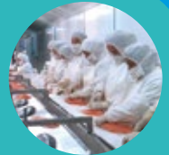
SAU THU HOẠCH

Tiêu chuẩn bao gồm: An toàn thực phẩm, An sinh Động vật, Phúc lợi cho người lao động, Môi trường, Truy xuất nguồn gốc và các lĩnh vực bền vững chính trong tất cả các giai đoạn sản xuất