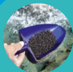
FABRICACIÓN DE ALIMENTOS PARA PECES